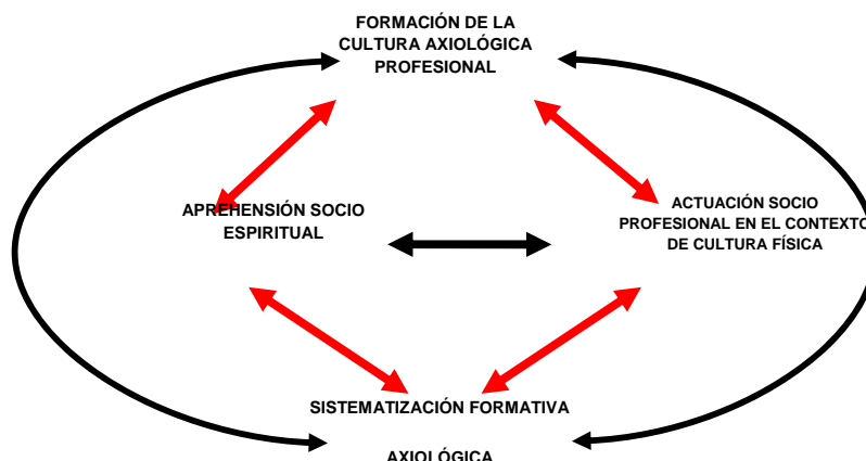
Fig. 2 Dimensión socio dinámica axiológica profesional.

En resumen, las relaciones esenciales que expresa el modelo de dinámica de la formación axiológica de los futuros profesionales de Cultura Física, son las siguientes: